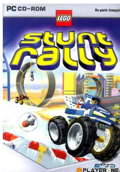
FIGUUR 1: HOES VAN HET COMPUTERSPEL LEGO STUNT RALLY.

Hoe dan ook, in Lego Stunt Rally doe je twee dingen stunts, en rally's rijden (duh). Zo rijd je op het ene moment door de jungle, het andere moment door de woestijn; Rijd je op het ene moment door een looping en op het andere moment over een enorme ventilator die je de lucht in blaast. Zoals de chauffeur van de auto op de hoes van het computerspel zich misschien voelt als hij op volle vaart op een looping afrijdt, zo voelde het NBSB-beker A zich misschien ook met het vooruitzicht van het spelen tegen de mannen van de Osse Schaakvereniging die afgelopen dinsdag bij ons bezoek kwam. Niet in de minste plaats omdat de teamleider van OSV niemand minder dan grootmeester Loek van Wely is, en ook de spelers die normaal gesproken worden opgesteld zijn bepaald geen prutsers. Dat beloofde een zware kluit te worden, en op die manier waren Niels, Sascha, Thomas en Jasper in hun eigen stunt rally terecht gekomen. Het werd de zwaarste kluit mogelijk, want Oss had alle registers opengetrokken en kwam zo'n beetje met de sterkst mogelijke formatie aanzetten in Eindhoven: