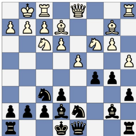
FIGUUR 2: STELLING NA 12. A4.

maar ik was op mijn hoede; ik wist niet eens wat hij speelde. Ik neem jullie aan de hand van drie stellingen mee door de partij.