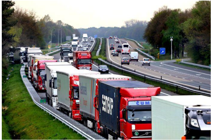
Figuur 1: Impressie van de A58 op de donderdagavond

Meteen op de weg daarnaartoe werd het al spannend. Aangezien we eigenlijk al een kwartier later vertrokken dan gepland, moest het onderweg eigenlijk wel meezitten als we optijd aan zouden komen. Nou, beste lezer, niets bleek minder waar te zijn. Een groot deel van de snelweg was bezet met vrachtwagens die er een handje van hadden om de gehele wegbreedte te bezetten.