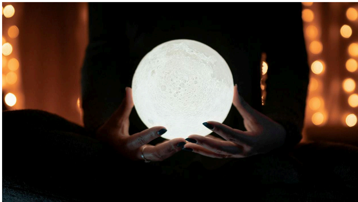
Figuur 1: Dit verslag is tot u gebracht door de kristallen bol.

Een verslag van de wedstrijd DSC A - WLC A