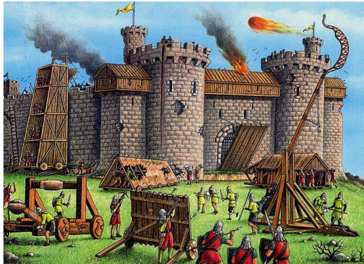
Figuur 1: Actiefoto van WLC 2 afgelopen zaterdag in Wijchen.