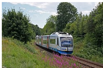
De Bayerische Oberland Bahn