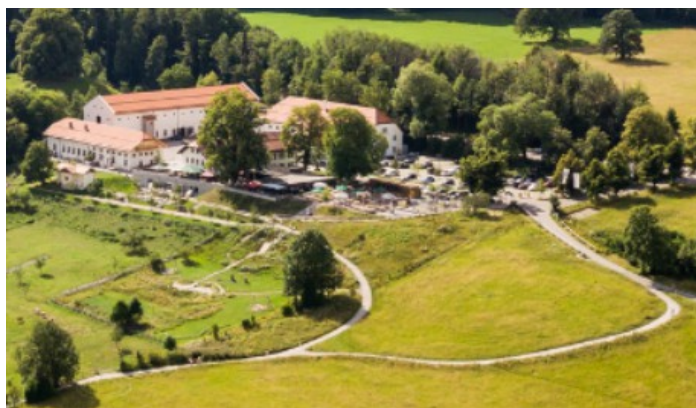
Gmund, Gut Kaltenbrunn, de speellocatie