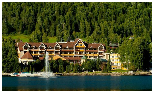
Fagernes, en het speelhotel

Een gepland toernooi rond de Paasdagen 2020, in Fagernes , Noorwegen, moest ik op het laatste moment afzeggen omdat de KLM de vluchten naar diverse bestemmingen annuleerde. De organisator moest het hele evenement vervolgens doorschuiven naar de herfstvakantie van 2020, omdat buitenlandse spelers door het strikte Noorse beleid eigenlijk helemaal niet meer werden toegelaten. Dus opnieuw proberen, maar een maand voor de tweede kans werd Noorwegen voor Nederlandse toeristen gesloten. Spoedig zouden echter bijna alle Europese nationaliteiten volgen zodat alleen Letten nog konden komen, plus een paar al in Noorwegen wonende schakers van niet Noorse oorsprong, en een Israëliër die het niet erg vond 10 dagen in quarantaine door te brengen voor aanvang van het toernooi. Waarhij hij overigens ook thuis dat proces weer moest ondergaan want die Noren beletten wel iedereen de toegang, zelf hadden ze hun zaakjes allerminst op orde.