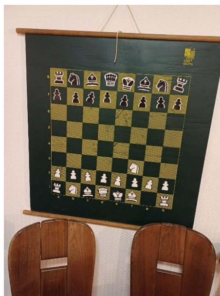
Figuur 1: De zet 1.Pf3! staat op het magneetbord! Is dit een hint?

We graptten nog naar onze tegenstanders dat dit een mogelijke hint zou zijn naar eventuele voorbereiding op bord 8, waar WLC de zwarte kleur zou bekleden. Lees vlug verder om erachter te komen of dit ook echt het geval was!